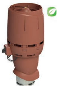
VILPE ECo FLOW 160P/500-takfläkt

Uppåtblåsande och energi-effektiv isolerad takfläkt med EC-motor samt säkerhetsbrytare. Styrs via extern 0-10 V styrsignal.